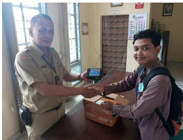
Gambar 3. Penyerahan alat pendeteksi uang palsu dan sistem peringatan dini bencana

Luaran ketiga berupa pembuatan dua buah sarana prasarana berupa, alat pendeteksi uang palsu dan Alat Sistem Peringatan Dini Bencana. Alat pendeteksi uang berbasis sinar ultra violet ini berbentuk kotak berukuran 15 x 8 cm. Salah satu kelebihanannya adalah pemakaiannya yang cukup mudah. Hanya memerlukan 1 tombol, meskipun demikian karena sifat sinar ultraviolet yang memiliki gelombang lebih pendek dari sinar matahari alat ini hanya bisa digunakan didalam ruangan.