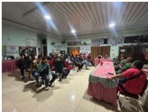
Gambar 1. Rundingan Sebelum Kegiatan Volley dimulai

Kerja sama yang terjalin dalam kegiatan persiapan ini menunjukkan adanya sinergitas yang kuat antara mahasiswa KKN dan masyarakat (Sigit Putra et al., 2024). Pembagian tugas dilakukan secara spontan namun terarah, di mana mahasiswa membantu dalam pengukuran dan pengecatan garis lapangan, sementara masyarakat dan pemuda desa fokus pada pembersihan serta penataan lingkungan sekitar. Suasana kebersamaan terlihat jelas melalui interaksi yang akrab dan penuh semangat gotong royong.