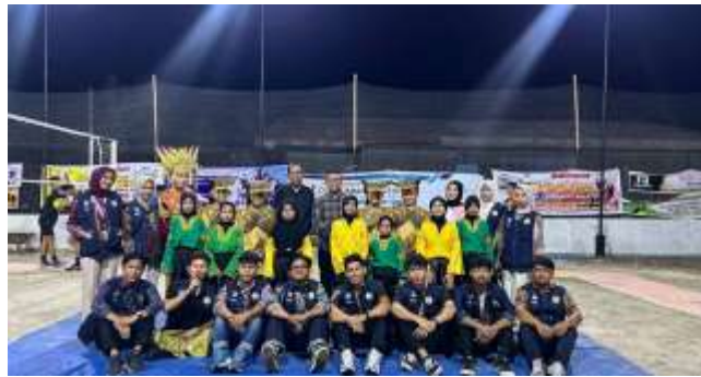
Gambar 4. Acara Penutupan Kegiatan Turnamen VolleyBall