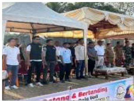
Gambar 2. Foto Bersama Kegiatan Pembukaan Turnamen

Pembukaan turnamen secara resmi dilakukan oleh Wakil Wali Kota Sawahlunto yang dalam kesempatan tersebut diwakili oleh Kepala Dinas Pemuda dan Olahraga Kota Sawahlunto. Dalam sambutannya, beliau menyampaikan apresiasi kepada mahasiswa KKN dan seluruh panitia atas inisiatif positif dalam menggerakkan kegiatan olahraga di desa. Selain itu, beliau juga berharap kegiatan ini dapat mempererat hubungan antarwarga serta menumbuhkan semangat sportivitas, kebersamaan, dan jiwa kompetitif yang sehat di kalangan generasi muda. Rangkaian kegiatan pembukaan diawali dengan doa bersama, dilanjutkan dengan sambutan resmi, serta pemukulan bola pertama sebagai simbol dimulainya pertandingan. Masyarakat terlihat antusias menghadiri acara tersebut dan memenuhi area sekitar lapangan untuk menyaksikan momen pembukaan.