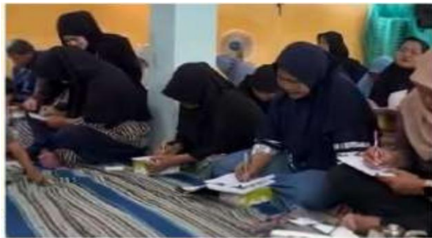
Gambar 4.1 Dokumentasi Kegiatan PKM