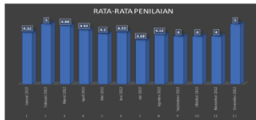
Gambar 1.1 Data kinerja karyawan PT Gana Sakti Indonesia Tahun 2022

Dari grafik diatas dapat di lihat bahwa pada Januari 2022 nilai rata-rata kinerja mengalami beberapa fluktuasi. Pada Januari 2022, nilai rata-rata mencapai 4.32 (Sangat Baik), lalu meningkat menjadi 5 pada Februari 2022, namun turun sedikit menjadi 4.88 pada Maret 2022. Pada April 2022, nilai rata-rata berada di angka 4.52 (Sangat Baik), kemudian turun lagi menjadi 4.33 (Sangat Baik) pada Juni 2022. Penurunan yang lebih signifikan terjadi pada Juli 2022, dengan nilai rata-rata turun menjadi 3.68 (Baik), sebelum kembali naik menjadi 4.33 (Sangat Baik) pada Agustus 2022. Dari data ini, dapat disimpulkan bahwa penilaian kinerja secara keseluruhan tetap berada dalam kategori baik hingga sangat baik, meskipun ada beberapa penurunan pada bulan tertentu pada bulan November 2022 tetap pada nilai 4 (Sangat Baik), dan pada bulan Desember 2022 naik menjadi 5 bulan Juli 2022 adalah 3.68, yang menunjukkan bahwa masih ada karyawan yang tidak memahami prosedur operasi standar (SOP) saat bekerja.